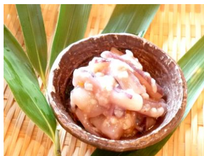
いかの塩辛 糍漬け